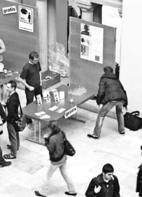
◀ Orangensaft-Aktion der BGS Zürich zum Einladen an Vorträge, Nov. 2010