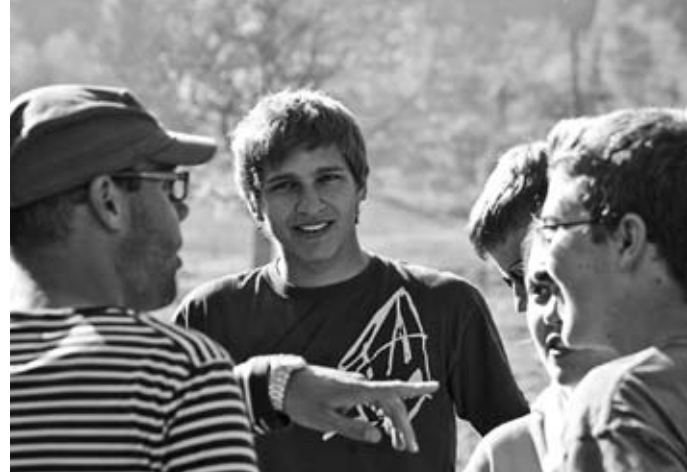
▲ Das Potential der Jugendlichen entdecken und fördern – hier im FollowHim, Okt. 2010