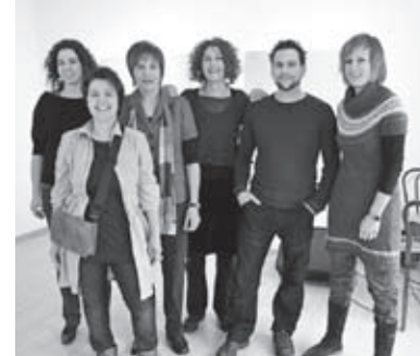
Fachkreis Bildende Kunst anlässlich der Ausstellung «Aufbruch» in Zurzach

Gefördert und verbreitet wurde dieses Anliegen durch Tagungen: